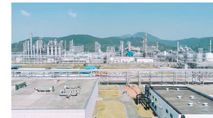
SEI埃克森美孚惠州乙烯一期项目效果图

SEI埃克森美孚惠州乙烯一期项目位于惠州大亚湾石化区，一期项目投资约450亿人民币，规划建设160万吨/年乙烯裂解装置，主要产品包括：120万吨/年茂金属聚乙烯、50万吨/年高压聚乙烯、47.5万吨/年抗冲聚丙烯、48万吨/年均聚聚丙烯。华星钢构中标该项目，该项目钢结构主要有框架、管廊、厂房，由柱、梁、支撑、设备钢支座等构件组成。不包含立体库中的网架及聚烯烃包装轻钢厂房，不包括