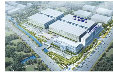
大丰文体创意及装备制造项目效果图

该项目建成后，大丰公司即完成由集成供应商向投资建设与运营商的转型，打造集现代文体装备产业基地、文化装备技术研发中心、文化创意产业基地以及轨道交通产