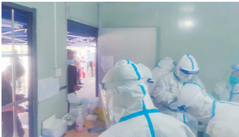
疫情期间志愿者服务

“来来来，过来这边，排好队”，“支付宝健康码打开一下”，“你这个地址要改在浙江”……这些天，这些话，我也记不清说了多少遍。有时候听起来很严厉，但其实我只是大声了一点，只想说一遍就能说清楚，让他们听得更明白。几个小时不能喝水，嗓子已经干了，以至于后来能不说话的不说。听到的最多的也就是“谢谢”，“你们辛苦了”。说实话，已经麻木了。连一个点头示意都不想回以对方。到了白天，